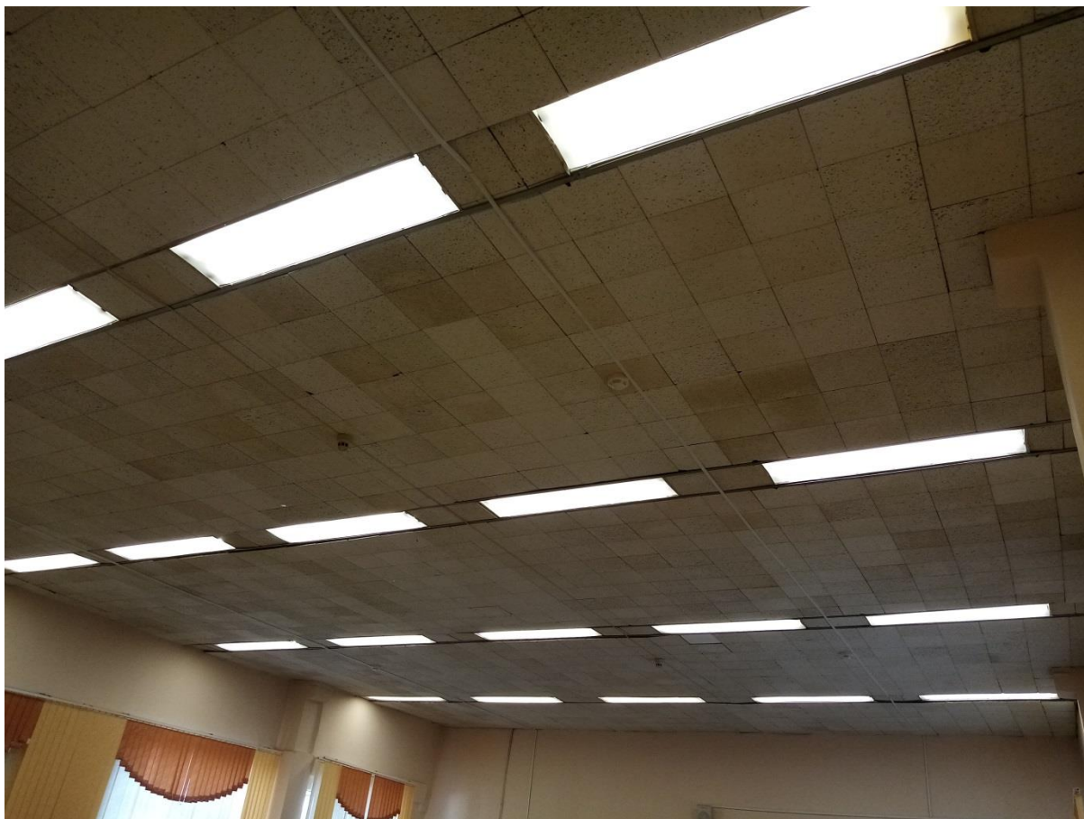
Фотография источников искусственного освещения в актовом зале